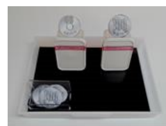
ステップアップキット